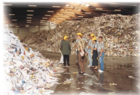
Nettingsdorf, Steyrmühl, ...

Papierfabriken können Altpapier ca. 6 Mal recyceln. Damit werden Rohstoffe und Energie gespart.